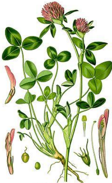
Trifolium pratense L.