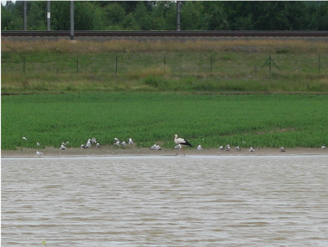
Awans, Fond du Chenay le 10 juillet 2008

Une parade nuptiale précède l'accouplement. Ces échassiers ne communiquent entre eux que par des claquettements de bec (pas d'appareil phonatoire).