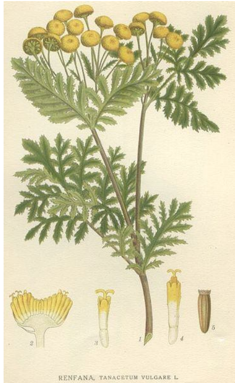
RENFANA, TANACETUM VULGARE L.