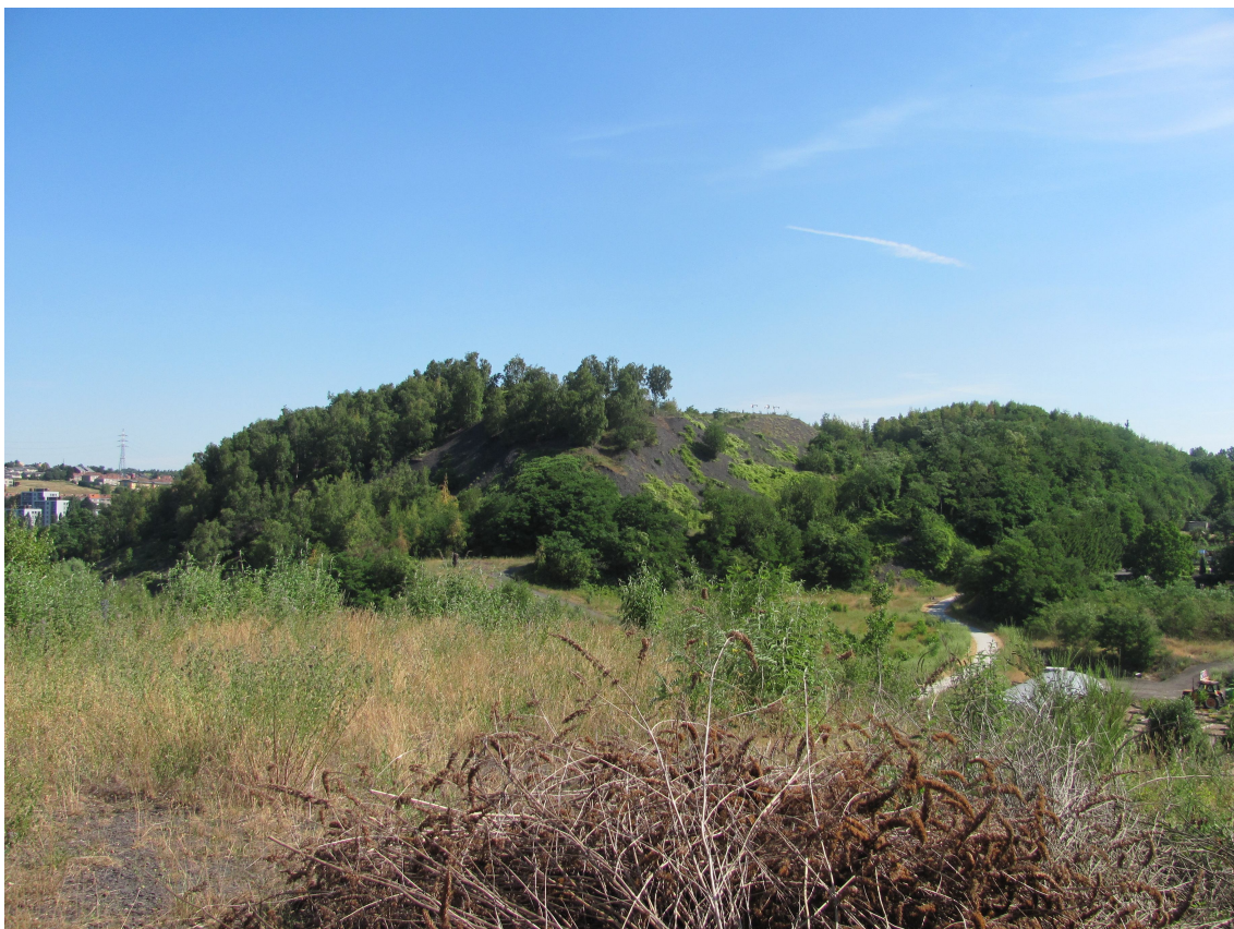
Un site exceptionnel au paysage « lunaire »

Sur ces sols, des espèces particulières de faune et de flore s'y sont développées.